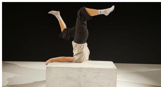
Résidence septembre 2024 Théâtre Simenon, Rosny

Utilisant le principe de l'imitation comme moteur de jeu, chaque personnage sera amené au cours de la pièce à comprendre l'autre, cet “étranger à soi”, avec son rythme propre, sa gestuelle et son mode expressif empreints du mystère de la différence. L'acrobate défiant les lois de la nature et de la gravité offrira une dimension extraordinaire, repoussant les limites. Elle permettra d'accéder, comme le danseur selon Nietzsche, à la part divine (ou au super héros) qui sommeille en chacun d'entre nous. .