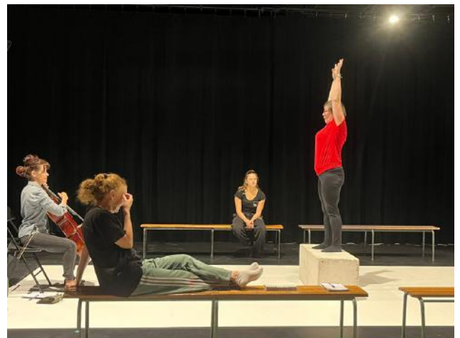
Résidence septembre 2024 Théâtre Simenon, Rosny