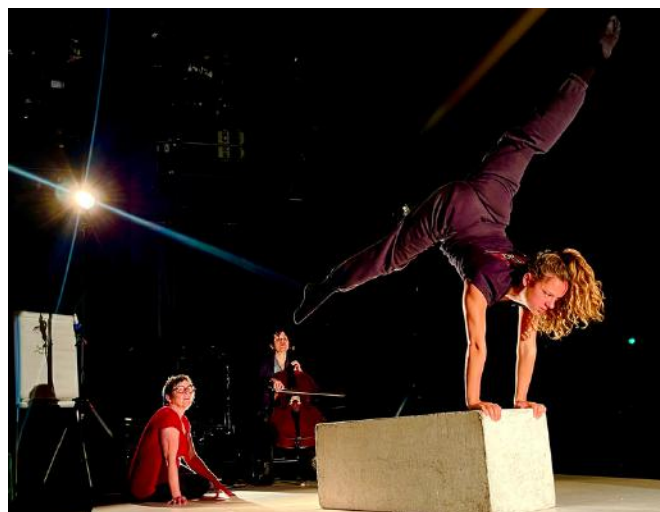
Résidence septembre 2024 Théâtre Simenon, Rosny

La représentation se termine par un temps inclusif et participatif durant lequel les enfants sont invités à partager l'espace scénique, à expérimenter quelques principes de jeu tirés du spectacle, et à découvrir de plus près le violoncelle.